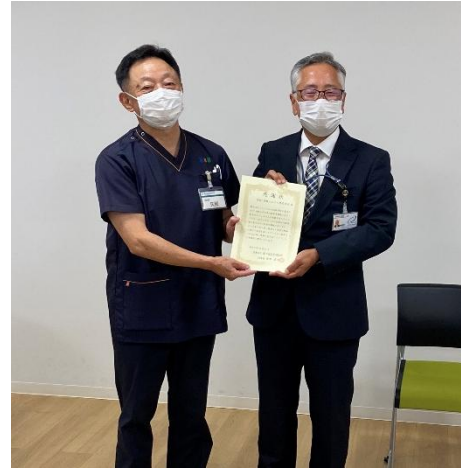
矢部理事長(左)より授与されました